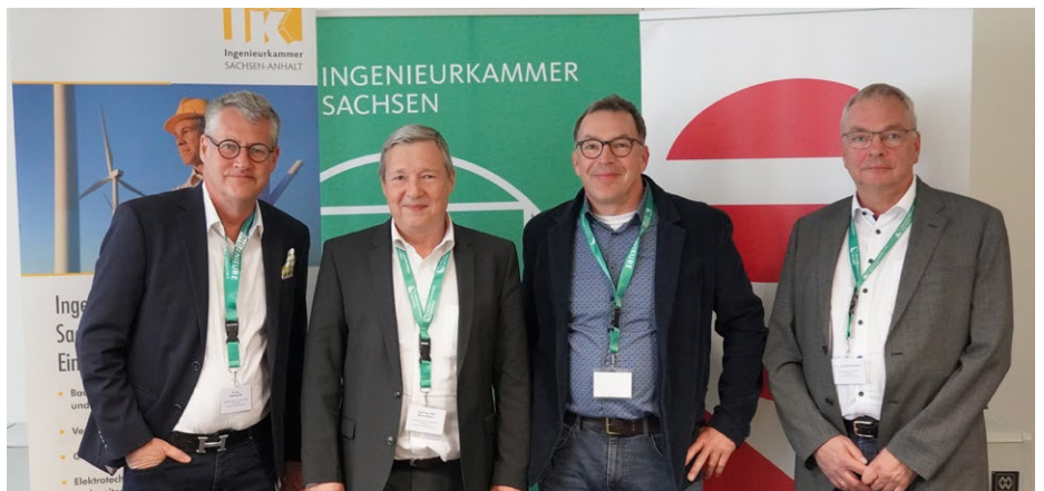
Arbeiten Hand in Hand: Die Vorsitzenden der Sachverständigenausschüsse der beteiligten Kammern.