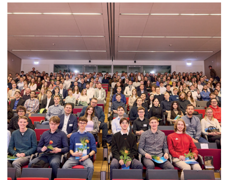
Stipendiaten und Förderer an der TU Dresden zur Stipendienfeier am 21. Januar 2025