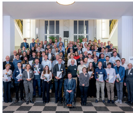
Stipendiaten und Förderer an der HTW Dresden zur feierlichen Vergabe am 14. November 2024