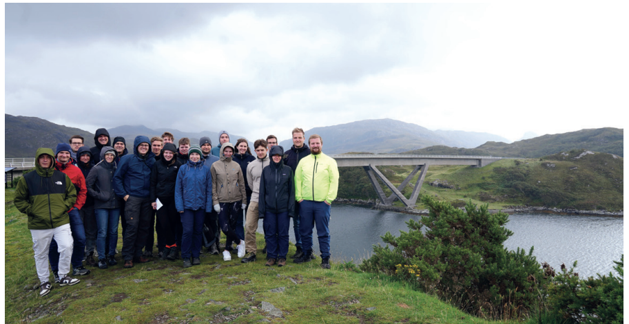
Die Exkursionsgruppe vor der Kylesku-Brücke in den schottischen Highlands

Die Brückenbauexkursion ist ein fester Bestandteil des Lehrprogramms des Instituts für Massivbau der TU Dresden. Sie wird jedes Jahr im Sommer, nach Abschluss der Prüfungsphase, mit Studierenden des 8. Semesters des Diplomstudiengangs Bauingenieurwesen durchgeführt und dient der praxisnahen Vertiefung der in den Vorlesungen erworbenen theoretischen Grundkenntnisse sowie dem Kennenlernen der internationalen Brückenbaukultur. Die Exkursion wird von den Studierenden zum größten Teil selbst organisiert, so dass bereits im Vorfeld der Exkursion eine intensive Auseinandersetzung mit dem Reiseziel und den zu besuchenden Bauwerken erfolgt.