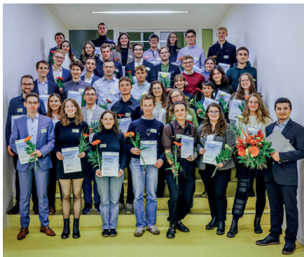
Stipendiaten von der HTWK Leipzig zur feierlichen Vergabe am 14. November 2024