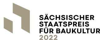
Ausstellung Sächsischer Staatspreis für Baukultur 2022

In seinen Publikationen und Vorträgen vermittelt er nicht nur fundiertes Expertenwissen zu Industrie 4.0 und den Entwicklungen der Zukunft, sondern ruft auch zu neuen, unkonventionellen Lösungswegen auf. Seine Botschaft: Innovation braucht technischen Sachverstand, Methodenkompetenz und vor allem den Willen, Innovation umzusetzen.