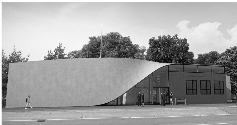
Der Standort des CUBEs (hier als Visualisierung) steht schon fest: Ecke Einsteinstraße / Zellescher Weg in Dresden.

Der CUBE (zu deutsch "Würfel") genannte Neubau bündelt die Ergebnisse der seit 2014 intensiv betriebenen Forschungen und soll gleichzeitig als weiterer Versuchsstand dienen. Geplant ist ein 220 m 2 großer Experimentalbau. Durch zwei symmetrisch gegenüber angeordnete Twist-Elemente, die gleichzeitig den seitlichen