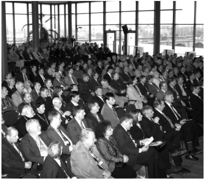
1. Mitteldeutsches Ingenieurforum 2008

Einen Termin sollten Sie sich in diesem Jahr schon jetzt rot im Kalender markieren: den 26. Oktober. Denn dann heißt es: Auf nach Leipzig zum 2. Mitteldeutschen Ingenieurforum der Ingenieurkammern Sachsen, Sachsen-Anhalt und Thüringen!