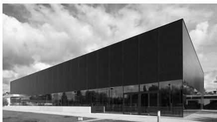
2013 ging der Sächsische Staatspreis für Baukultur an die Park Arena Neukieritzsch (Foto: CODE UNIQUE Architekten GmbH, Dresden)

Die Architektenkammer Sachsen, die Ingenieurkammer Sachsen und das Sächsische Staatsministerium des Innern loben im Jahr 2017 erneut den Staatspreis für Baukultur aus. Der Preis wird für Leistungen auf dem Gebiet der Baukultur in Sachsen verliehen. Mit dem Preis werden Bauwerke / Objekte gewürdigt, die das Niveau der Baukultur im Freistaat Sachsen heben. Die Bewertungsmaßstäbe der Jury sind dabei u. a. eine hohe Qualität der Einheit von Funktion, Gestaltung und ingenieurtechnischer Innovation sowie der ressourcenschonende Umgang mit der Natur.