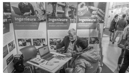
Mehr als 33.000 Besucher kamen auf die Karrierestart 2017. Natürlich interessierten sich viele Schüler auch für den Ingenieurberuf und ließen sich hierzu beraten.

„Was macht eigentlich ein Ingenieur?“ – Das war vermutlich die am häufigsten gestellte Frage, der sich die Standbetreuer der Ingenieurkammer Sachsen und des VDI auf der diesjährigen Karrierestart stellen mussten. Dabei zeigte sich, dass das Interesse junger Menschen am Ingenieurberuf zwar nach wie vor stark vorhanden ist. Jedoch mangelt es den meisten Schülern – verständlicherweise – an konkreten Vorstellungen. Ziel unseres Ingenieurstandes war es, diese Lücke zu schließen und einen Einblick in die Voraussetzungen und in den Werdegang eines Ingenieurs zu geben. Hierfür bot die Karrierestart 2017 das perfekte Umfeld. Mit 500 Ausstellern und mehr als 33.000 Besuchern konnte die Messe Rekordzahlen vermelden. Diese Resonanz schlug sich auch am Stand der Ingenieurkammer und des VDI nieder, so dass die anwesenden Betreuer sich nahezu durchgehend in Beratungsgesprächen befanden.