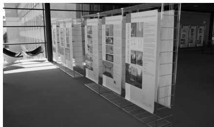
Im Jahr 2013 beteiligten sich mehr als 60 Ingenieurbüros an der damaligen Ausstellung im Sächsischen Landtag.

Ab Mai 2016 wird es eine Neuauflage der erfolgreichen Ausstellung "Sachsen – Land der Ingenieure" im Sächsischen Landtag geben. Bereits im Jahr 2013 war dies eine der meist besuchten Ausstellungen im Foyer des Landtages. Bitte merken Sie sich schon jetzt den Eröffnungstermin vor: 24. Mai 2016, 18 Uhr.