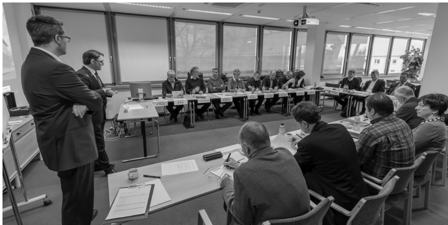
Am 20. Januar fand der erste moderierte Workshop zur Erstellung eines Leitbildes für die Ingenieurkammer statt.

Offizielle Kammer-Nachrichten und Informationen